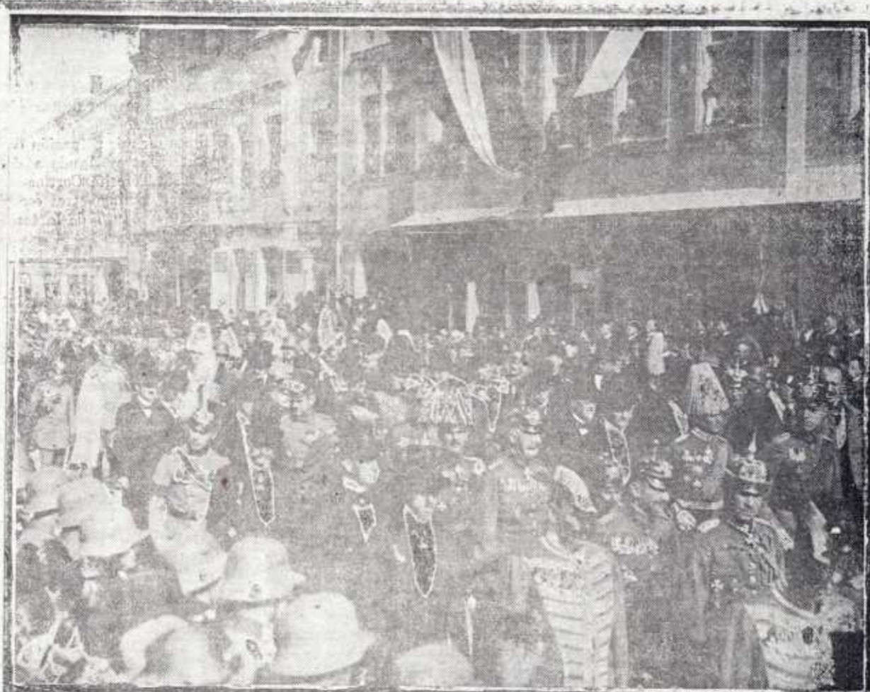
ALEMANIA.— ENTIERRO DEL EX REY DE WURTEMBERG.—PRESIDENCIA DEL DUELO Y CORTEJO.

música ni fuerzas vivas ni bandera. En silencio, aparte de algunos vivas aislados y unos cuantos aplausos, desfiló la columna por la calle de Alfonso XIII, trayendo los trofeos de la guerra, matas de espino y flores rupestres en los cañones de los fusiles. Solo las campanas de la Iglesia, tocadas a rebato, acompañaron el desfile de las fuerzas. Las campanas se portaron ayer bravamente. Con el regreso de la tropa se fueron sabiendo noticias. Quedaron ocupadas cuatro posiciones: Hardu, Kol-la, Taguil-Griat y Basbel, con un batallón, una compañía, treinta hombres con un suboficial y cincuenta con un alférez, respectivamente. Como ya dije ayer, las columnas de al lado de acá no dispararon un tiro. En cambio la de Sanjurjo, la que entró por la Tazuda, tuvo que sostener todo el día un tremendo combate con la morisma que acudió de Ras Medua y de Yazanem, teniendo alrededor de doscientas bajas; los mas castigados fueron el batallón de la Princesa número 4 y el Tercio, que se batieron bizarramente, llegando al cuerpo a cuerpo. Entre dichas bajas hay ocho o nueve de oficiales. Un verdadero dolor, porque si se hubiera dejado la operación para unos días mas adelante, cuando ya se hubiera avanzado por la meseta de Beni-Flankan, el Gurugú se habría tomado sin bajas, o como en 1909, que solo costó 4 o 5 he-