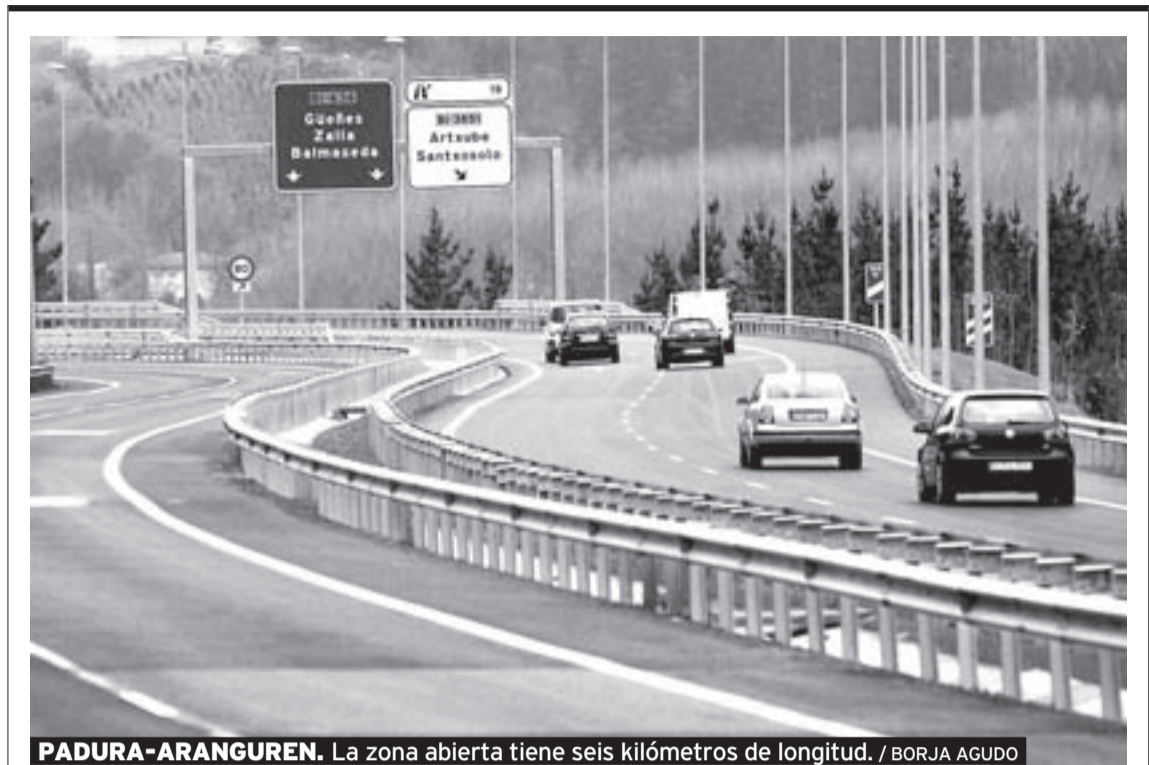
PADURA-ARANGUREN. La zona abierta tiene seis kilómetros de longitud.

Idom calcula el incremento de un coche por inmueble, lo que estimamos que se traduciría en 4.400 desplazamientos más diarios por esta carretera —cuatro por vehículo—.