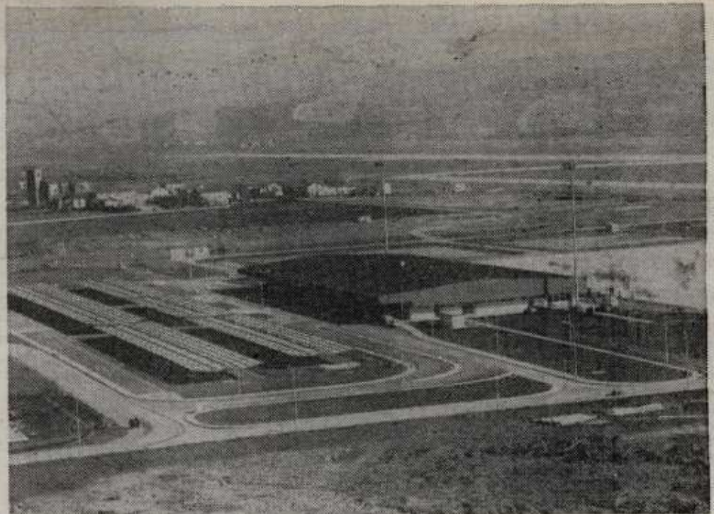
El aeropuerto ha ocupado seiscientos hectáreas y obligó al derribo de un pueblo, Otaza. Junto a la terminal puede observarse la localidad de Antezana. Algunas casas están ya vacías.

La puesta en marcha regular del aeropuerto no tendrá lugar hasta el 6 de abril, fecha prevista para que Iberia comience sus operaciones. La semana próxima se dará a conocer de forma oficial el programa de vuelos de esta compañía, que en principio