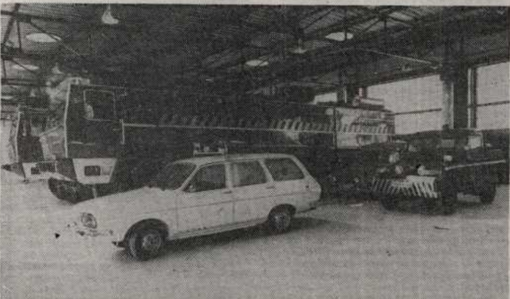
El parque de bomberos se encuentra listo. Cada unidad ha costado cuarenta millones. Minuto y medio después de sonar las alarmas pueden estar en cabecera de pista.