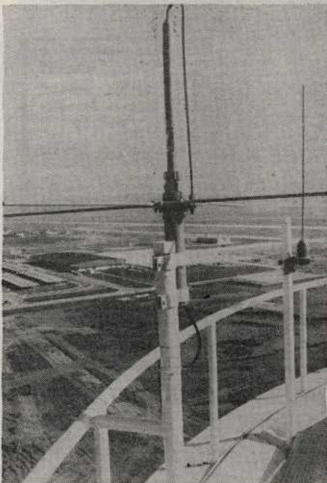
Las antenas de la torre de control permiten los enlaces radioeléctricos. Cien metros más abajo se encuentra el bloque técnico y la pista.

En el aeropuerto trabajan doscientas cincuenta personas que incluyen desde ingenieros superiores hasta maleteros, peones o personal de limpieza. Su crecimiento no será en cualquier caso proporcional al del propio aeropuerto.