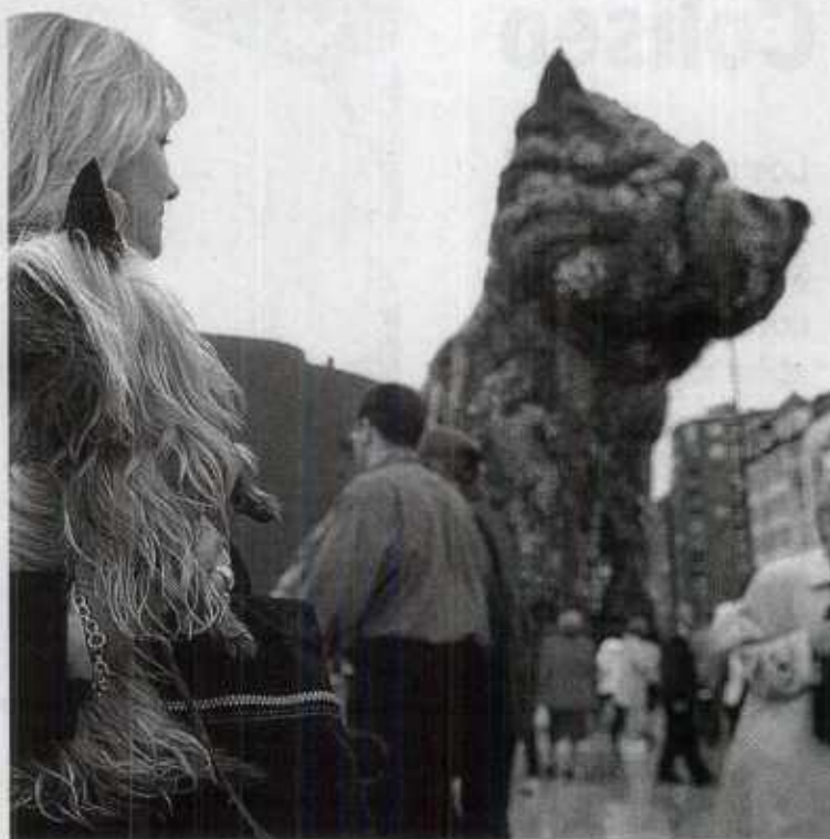
Los ciudadanos reclaman equipamientos de animación.

El ponente aseguró que «la ciudad se ha revalorizado como lugar económico y social». En su opinión, además, es necesario pensar «en la gente de la propia ciudad que revaloriza el espacio pú-