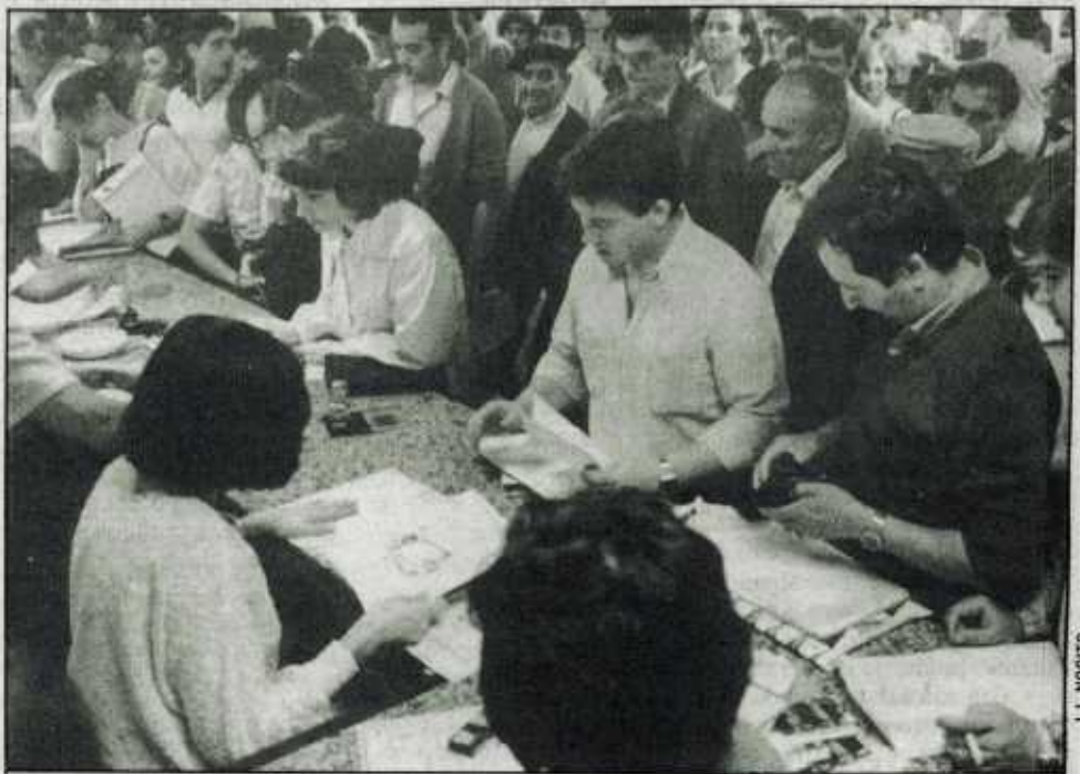
Las colas comenzaron a las ocho de la mañana...

«Mire usted, en esta comunidad autónoma se ha especificado claramente que la fecha tope de entrega de las declaraciones ha sido la del día de hoy, 25 de Junio. Se ha insistido suficientemente en este extremo y por esta razón no hay nada que haga prever una prórroga en el plazo. Ahora bien, es cierto que determinadas personas, quizá por despiste, han confundido los plazos de la Hacienda estatal que finalizan el día 30, con los de la comunidad autónoma, con fecha tope el día 25, y tal vez este despiste haya sido fruto de los anuncios que se