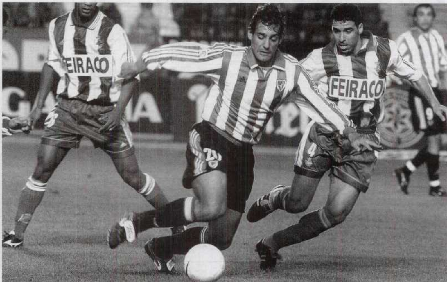
EN RIAZOR. El Athletic estrenará el campeonato frente al vigente campeón de Liga.

Sobre todo si se tiene en cuenta que después llega una zona del calendario (entre la jornada 10 y la 13) en la que los rojiblanco se miden a equipos que le superaron en la tabla la pasada temporada,