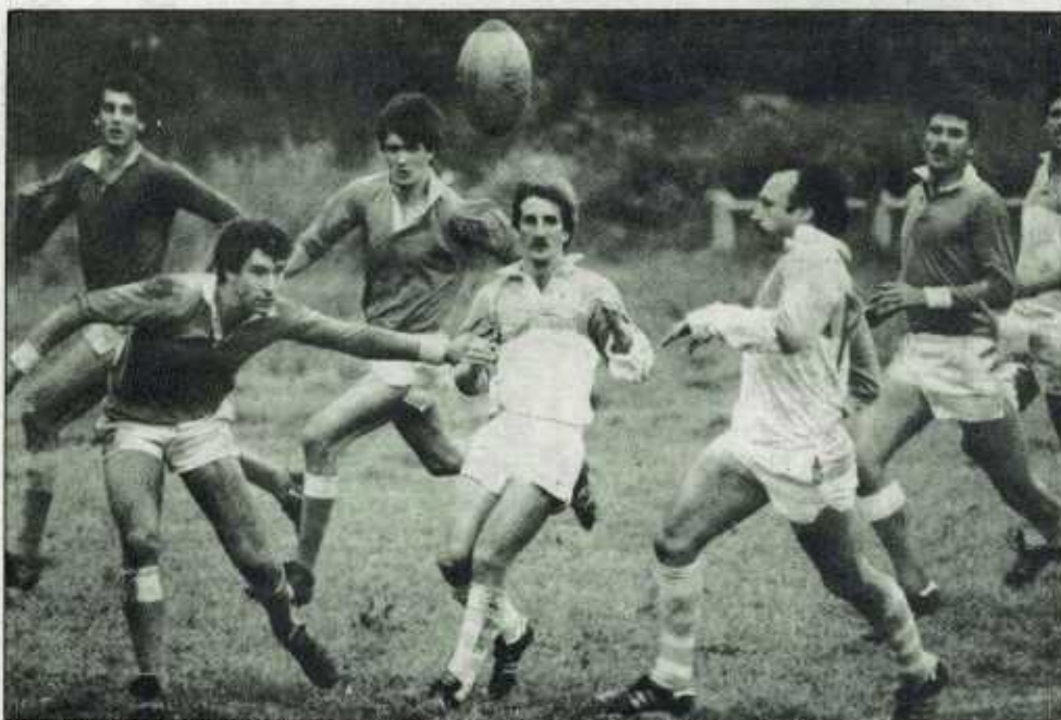
Los internacionales del Avirón impusieron su ley en los últimos minutos.