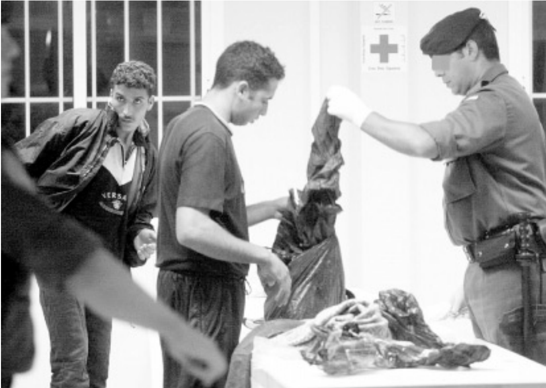
ARRESTO. Un agente revisa las pertenencias de dos de los magrebíes interceptados.

El ministro de Interior, Mariano Rajoy, aseguró ayer que los inmigrantes conocían desde su escala en Santo Domingo que no podrían entrar en España. Rajoy denunció que el grupo «venía manipulado y engañado por unas mafias».