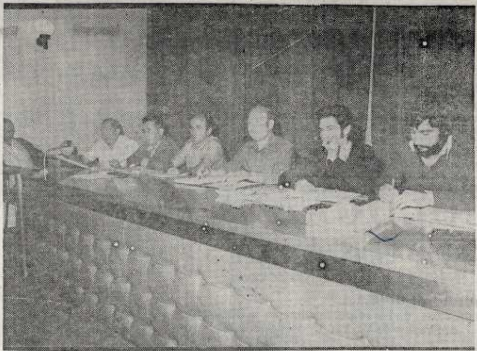
Los delegados de la construcción manifestaron ayer su total apoyo a los acuerdos llegados por la comisión negociadora

Si bien en un principio la propuesta de la parte social en materia de plus se centraba en 3.000 pesetas, ante la lógica prioridad de que la comisión negociadora dio a lo relativo, a derechos sindicales y tablas de rendimiento, se acabó por aceptar la propuesta patronal que en sí no está muy distanciada de los intereses de los trabajadores. El acuerdo al respecto, que recogerá el convenio es el siguiente: «Los trabajadores con jornal diario que no hayan venido percibiendo durante la vigencia del convenio cantidades superiores a las pactadas en el mismo y que, asimismo, no hayan venido percibiendo durante estos meses una cantidad en concepto de plus extrasalarial, superior a las 700 pesetas, también por semana ordinaria, durante los últimos cinco meses restantes de vigencia del convenio, tendrán derecho a percibir en concepto de atrasos correspondientes a todo el año de vigencia del convenio incluido el mes de mayo de 1978, por este capítulo de plus extrasalarial, la cantidad de 2.598 pesetas. Esta cantidad se refiere a todo el año de vigencia y por tanto será prorrateable en la parte proporcional que corresponda en función del tiempo de trabajo; bien será por tiempo de permanencia en la empresa o bien por las situaciones de ILT u otras situaciones semejantes. La cantidad correspondiente a estos atrasos en el plus extrasalarial,