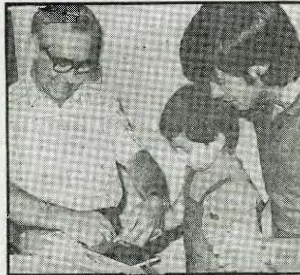
El niño logroñés en el momento de estampar la huella dactilar para el documento nacional de identidad.

Al niño le ha correspondido el número 16.527.763 y según confesó uno de los funcionarios, éste es el segundo caso que él conoce. El primero tuvo lugar también en Logroño en el año 65, siendo el protagonista un niño de seis años, de Calahorra, y también por cuestión de he-