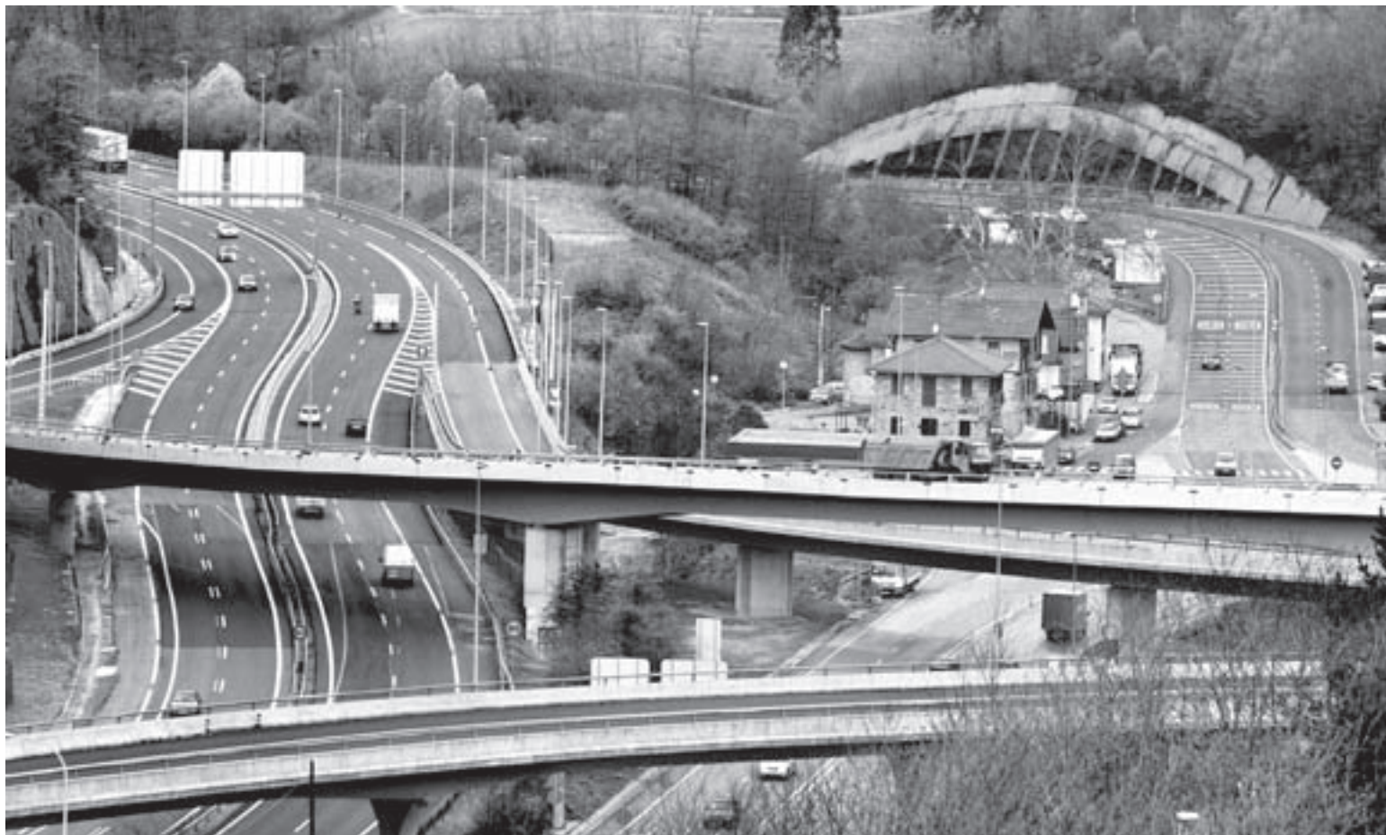
VÍA LIBRE. Imagen de los dos ramales que conectan la autopista y el corredor del Txorierri a la altura de Erletxe.

La Diputación abrió ayer al tráfico el ramal que conecta las dos infraestructuras en Erletxe y cierra el anillo de carreteras de Bilbao