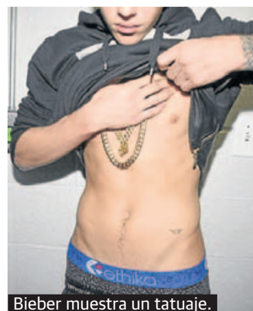
Bieber muestra un tatuaje.

arresto de Bieber, excepto cinco partes catalogadas por sus abogados de carácter íntimo, especialmente cuando el cantante es sometido a pruebas de orina. La divulgación de las imágenes fue solicitada por varios medios de comunicación que consideran que las leyes de Florida permiten el libre acceso a los registros de carácter público. Las imágenes del intérprete, que cumplió el sábado 20 años, fueron grabadas por cámaras de seguridad durante su detención el 23 de enero por conducir bajo la influencia de drogas.