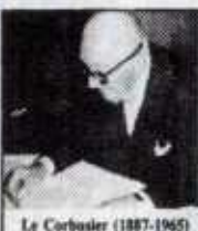
Le Corbusier (1887-1965)