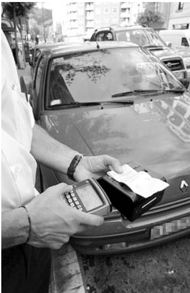
Un vigilante de la OTA impone una multa.