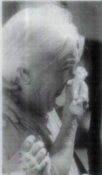
Una mujer llora en la misa.

Profesores y compañeros de las víctimas guardaron cinco minutos de silencio en el patio de la escuela Modolell. «No pensaba que podía morir tanta gente. Y de mi mejor amigo, al que