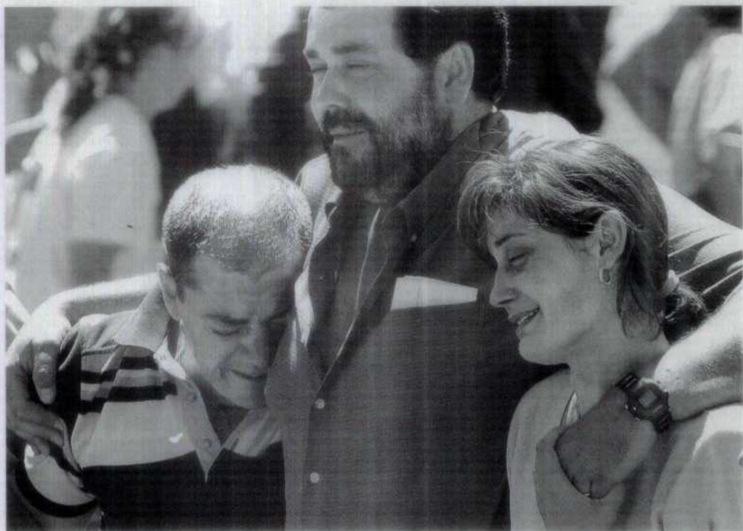
ABATIDOS. Abrazo emocionado entre padres que han perdido a sus hijos.