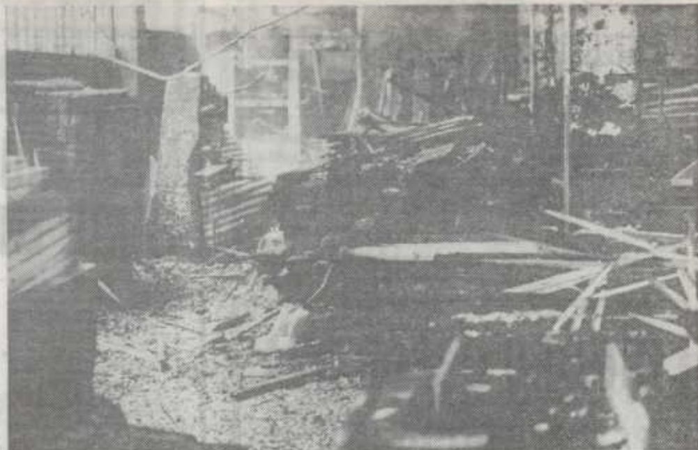
Estado que presentaba la carpintería.

★ Las pérdidas se calculan en unos siete millones de pesetas