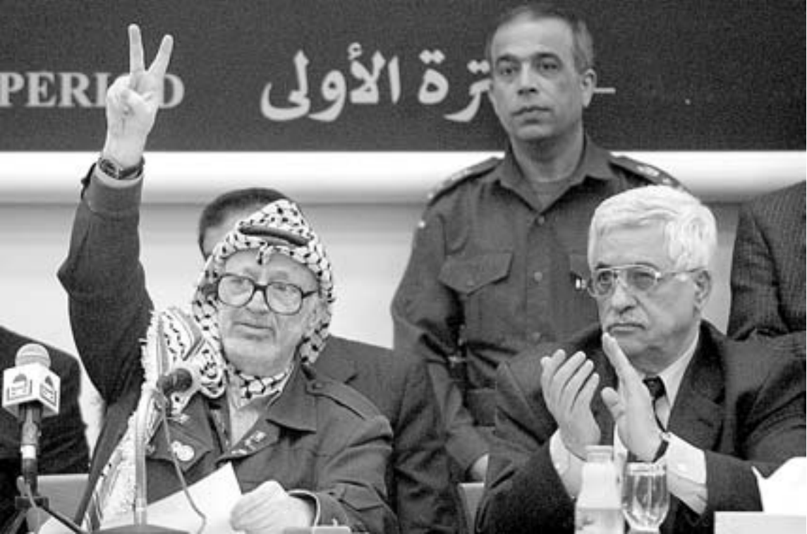
Arafat hace el signo de la victoria, mientras es aplaudido por el nuevo primer ministro, Mazen.