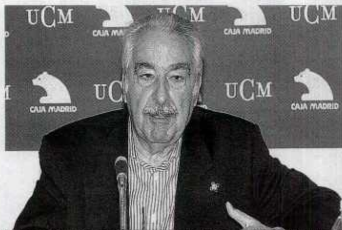
Alvaro Mutis ha participado en un curso en El Escorial.