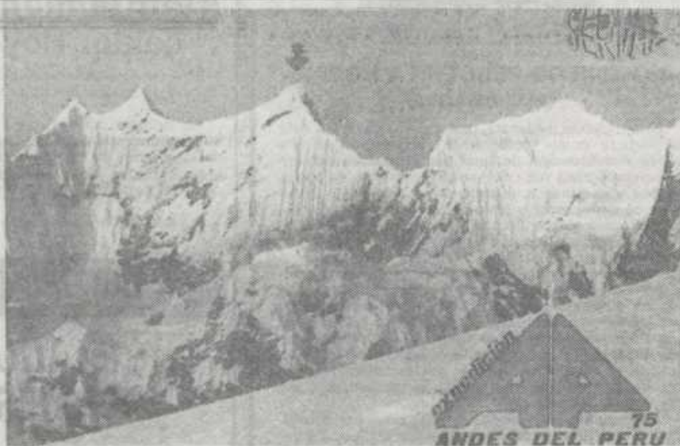
Los escaladores, para financiarse el viaje, mandarán esta postal, firmada por todos, desde el Perú, a quienes les ayuden con diez duros. Con flecha, el Puca Hirca Central, de 6.050 metros, objetivo de la expedición.