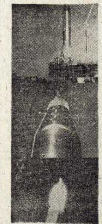
momento de ser lanzado en Cabo Canaveral: El proyectil, dispuesto para el lanzamiento, el morro en el que va el "satélite" y el instante de la salida. El "Atlas", como se sabe, pesa 4.500 kilos y lleva a bordo instrumentos científicos con un peso aproximado de 150 libras. Desde su emisora ha sido transmitido a la Tierra el mensaje de Navidad de Eisenhower.

El Comité de la Agencia del Espacio, por su parte, ha encargado a la Administración que prepare inmediatamente dos tentativas "fuera de programa" para llegar a la Luna, con los sistemas actualmente disponibles. Una resolución enviada a las Fuerzas Aéreas para realizar los lanzamientos con cohetes ligeros del tipo "Thor-Abel", ha llegado ya a Cabo Canaveral.