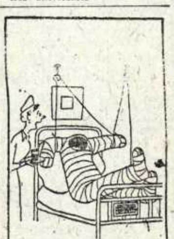
--Vamos, vamos, no sea niño: ya sé que está usted escondido dentro. (De "Punch")

Mientras los augures se entretienen en cálculos de edad, el canciller celebra su ochenta y tres aniversario.