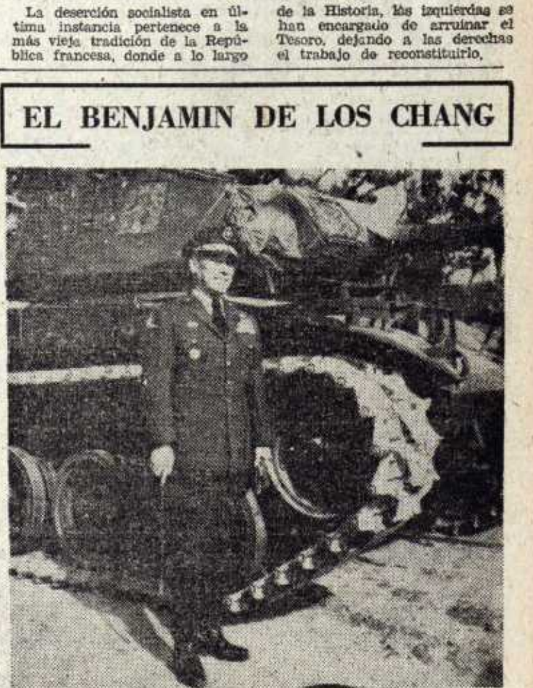
Junto a un carro de combate de la China Nacionalista aparece el Mayor General Chang Wei, hijo menor del presidente Chang Kai Chek y jefe de las fuerzas acorazadas del Ejército de Formosa.—Chang Wei estudió en Academias norteamericanas, y alcanzó el grado que ostenta actualmente durante la lucha contra los comunistas chinos en el Continente.

Pero mientras los socialistas realizan esta fuga ante las responsabilidades, el M. R. P. parece que decidirá el próximo jueves participar en el Gobierno Debre, por lo menos autorizando a varios de sus líderes a aceptar la cartera ministerial, aunque sea a título personal. El M. R. P. separarse del socialismo, quizá rompa, en homenaje a la gravedad de la situación, una alianza que tenía mucho de incomprensible, aunque haya tenido bastante más de constante.