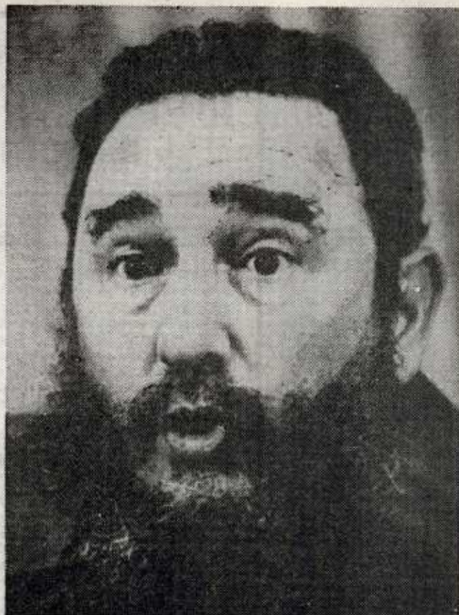
El presidente cubano, que asistió al cuarto aniversario de la revolución etíope.