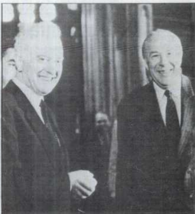
Shevardnadze (izquierda) y Shultz, en un encuentro entre los dos responsables de Exteriores de las superpotencias.

El precio que tiene que pagar Washington consiste en renunciar a la reconversión