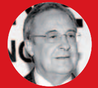
Florentino Pérez Presidente del Real Madrid

Porque San Mamés ha sido mucho más que un campo de fútbol. En cierto modo, ha sido un templo que ha habido que ir remodelan-