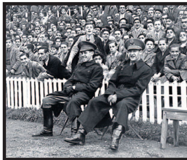
Seguridad. El público y los policías sonríen durante el partido.

tadio, que con el tiempo se convirtió en uno de los grandes santuarios del fútbol, va a desaparecer. Faltan pocas horas para que entren las picaretas y las excavadoras. Y el vacío que va a dejar el viejo San Mamés es tan profundo que muchos nos tememos que ese solar vaya a quedar encantado para siempre. No