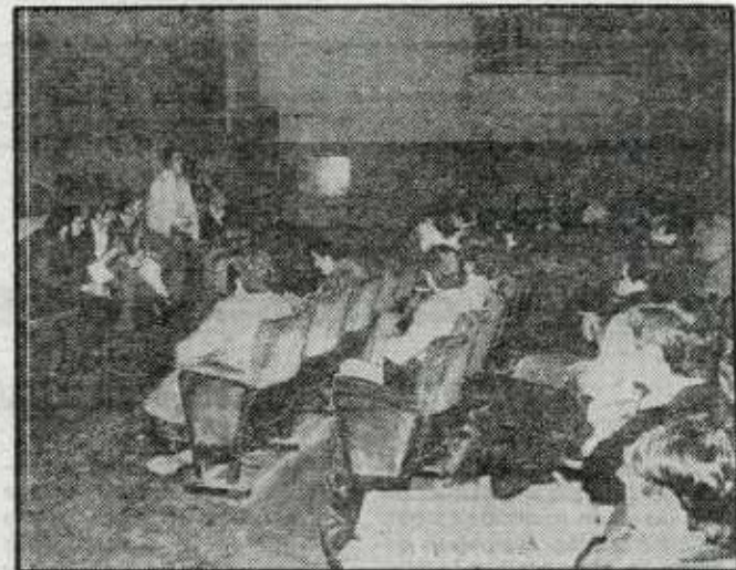
En la fotografía, un momento de la asamblea en San Francisco. (Foto Miguel Angel).

La impugnación del convenio se decidió en una asamblea de todos los trabajadores. Según nos manifestó uno de los letrados, las razones fueron la total ausencia de mejoras de tipo social en el convenio y que se creaba un peligroso precedente, ya que una central, que apenas tenía representación en un sector, podía firmar el convenio sin tener en cuenta a la mayoría de los trabajadores.