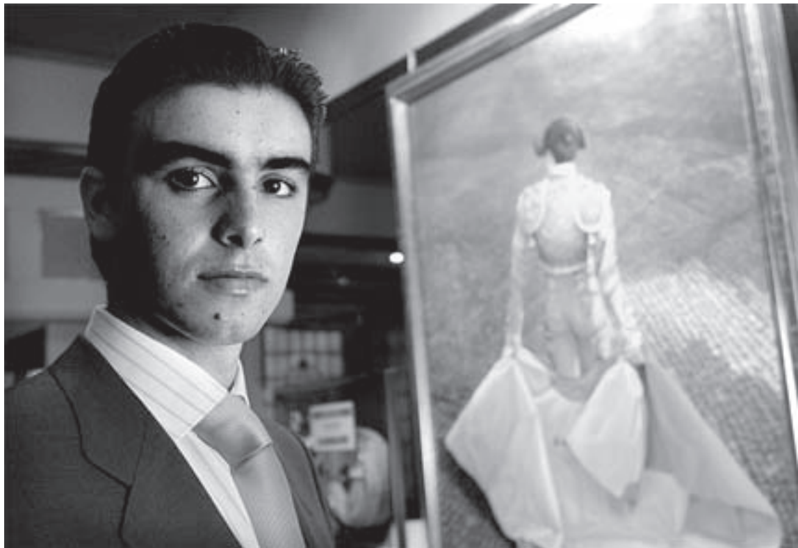
PROYECCIÓN. Perera afirma que los aficionados reconocen su «sello»