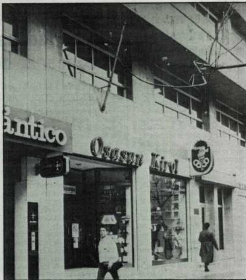
Los maestros jubilados reclaman el cobro inmediato de las pensiones. En la imagen, la delegación territorial de Educación y Ciencia de Vitoria.

Los pensionistas adeudados vislumbran en esta compleja evolución «el tenebrismo, la opacidad y poca diligencia de los servicios