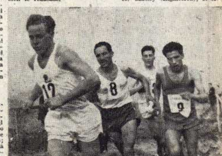
HEATLEY, gran vencedor del "Cross de las Naciones", conduce el grupo de cabeza en un anterior Cross Internacional de Lasarte, seguido por Mimoun, Amour y Roelants.

Roelants, desahogado, perdía fuerzas, y aunque entró en tercera posición, tampoco pudo impedir que el español Amoros también le rebasase.