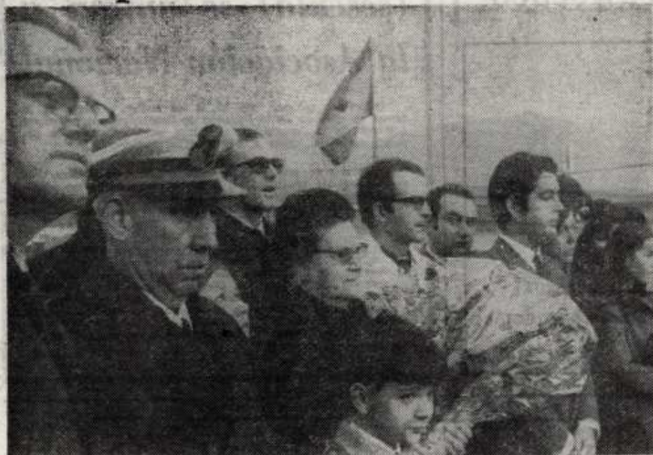
La señora de Beldarrain, junto a las autoridades y directivos de Astilleros del Cadagua, presidiendo el acto de botadura.