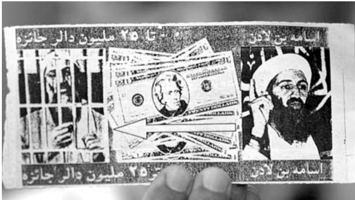
RECOMPENSA. EE UU ofrece 25 millones por información sobre el paradero de Bin Laden.

El presidente paquistaní, general Pervez Musharraf, en unas declaraciones a la cadena estadounidense CNN, indicó en relación al paradero de Bin Laden que estará escondido en «una zona remo-