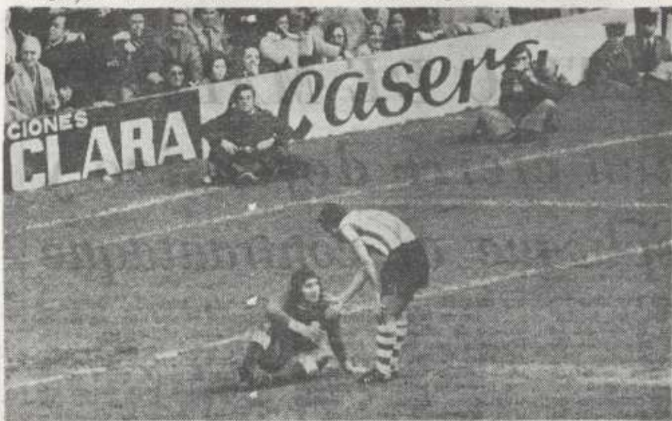
OVEJERO acabó de marcar en su propia meta el primer gol de la tarde. URIARTE se le acerca para consolarle por su fallo y de paso le extiende la mano para ayudarlo a levantarse.