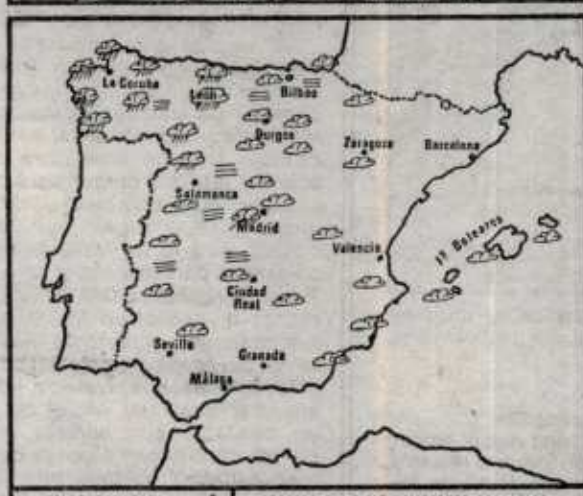
ISLAS CANARIAS ASPECTO DEL CIELO Y TIPO DE TIEMPO PROBABLES DE HOY A MAÑANA NUBOSIDAD VIENTO FUERTE NIEVE LLUVIA O CHUBASCOS TORMENTA

Mar. —Gran Sol y mitad occidental de Vizcaya: Vientos del tercer cuadrante, fuerza 5 a 6.