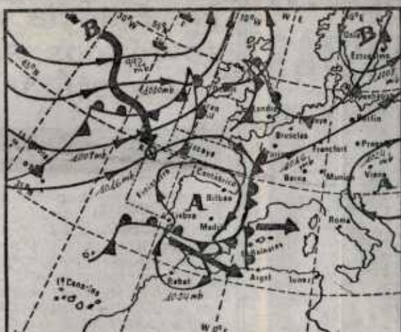
MAPA DEL TIEMPO FRENTE DE LLUVIA FRENTE DE CHUBASCOS ANTICICLON BORRASCAS

Resto de Europa: Estocolmo, 3; Copenhague, 0; Londres, 7; Bruselas, 7; Ginebra, 6; Zurich, 9; París, 7; Burdeos, 14; Lyon, 8; Lisboa, 17; Frankfurt, 7; Roma, 13; Milán, 6.