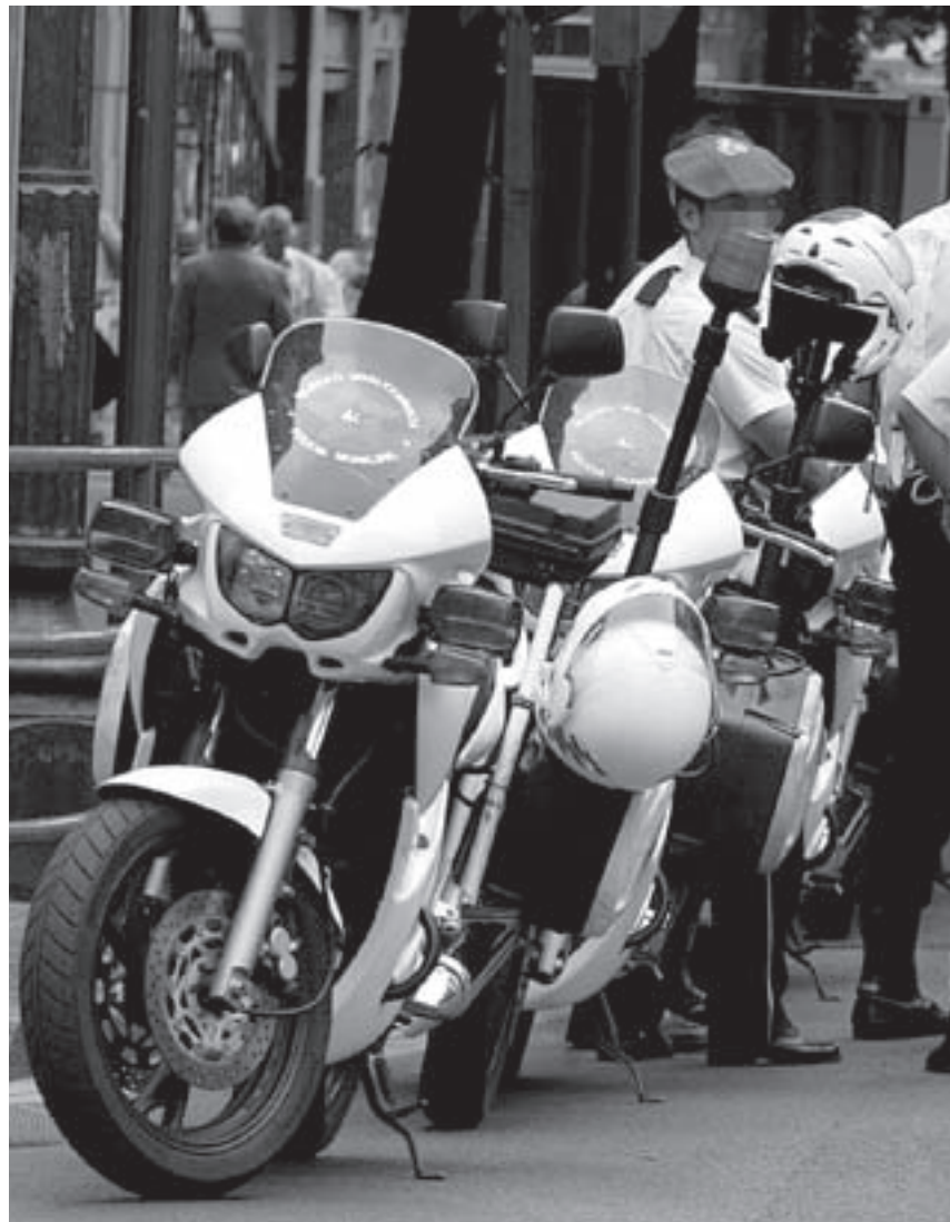
Los cuerpos de policía locales y los bomberos suelen encabezar la