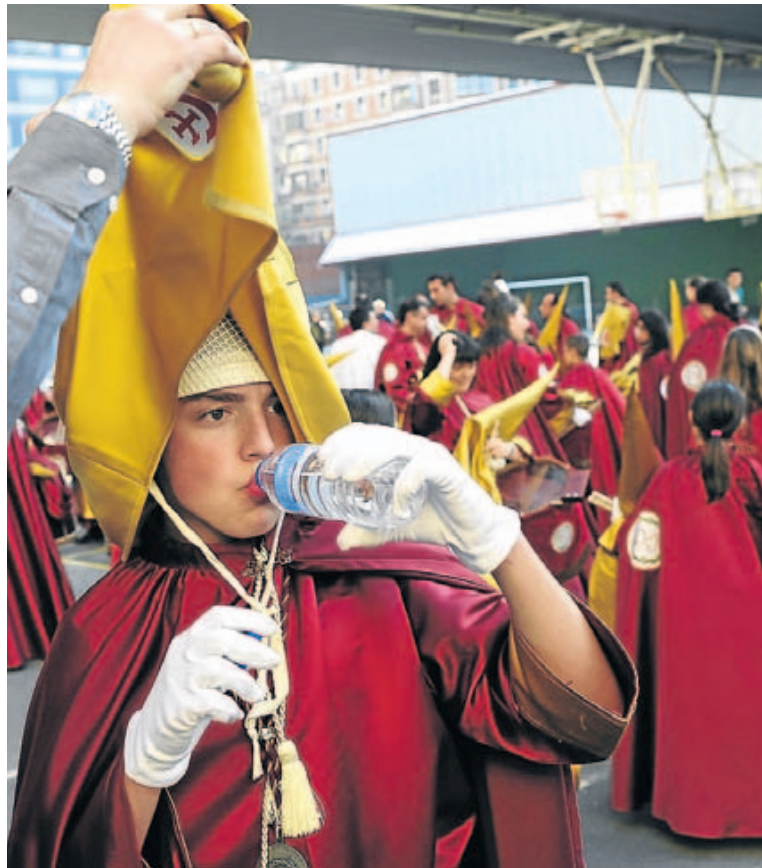
Un joven cofrade bebe agua antes de comenzar el desfile.

Más de 650 cofrades bilbaínos y logroñeses desfilaron con la Virgen de la Amargura en la procesión que recorrió el centro de la ciudad