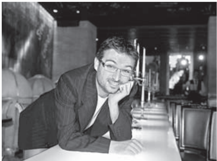
JORDI ÉVOLE es el conductor del espacio.

«El tono supera los límites razonables de la libertad de expresión»