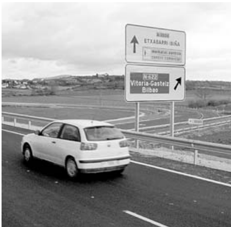
EL SEGUNDO tramo unirá Luko con el enlace de Echávarri.

La primera fase, de las dos en que se divide el proyecto, afectará al tramo que va de Luko al lími-