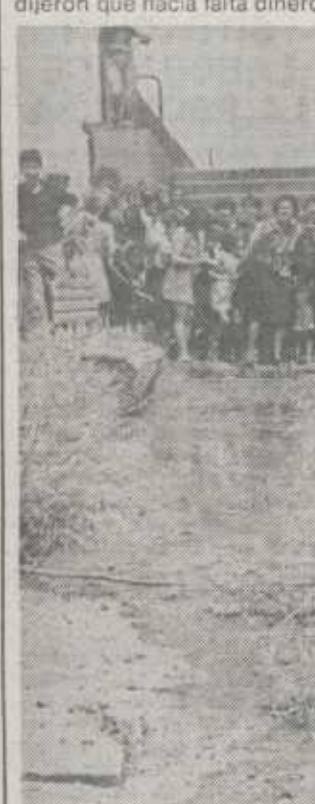
Las bermeanas quisieron acompañarle a nuestra redactora hasta el «pozo negro», uno de los graves problemas de La Atalaya

y dieron por cabeza de familia 3.700 pesetas. Pero el «pozo negro» está desbordado y la oleada de aguas residuales se ha extendido por toda la parte trasera de uno de los bloques, subiendo olores e insectos a los vecinos.