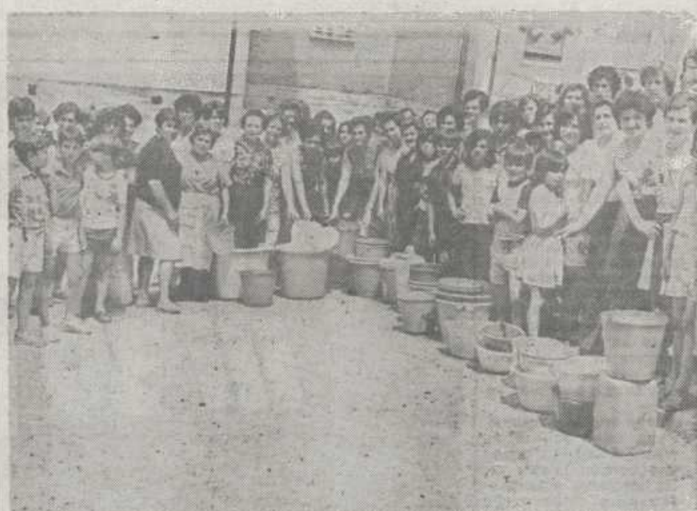
Falta agua. Y tienen que esperar con sus cubos a que lleguen los camiones-cisterna