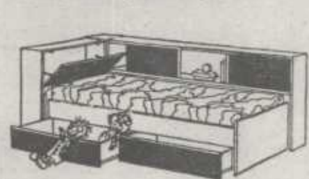
Diván-nido muy práctico para dormitorios infantiles en espacios reducidos.