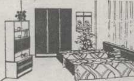
Dormitorio - sala estar. Dos camas, armario ropero, mesilla con galería de luz, tocador, escritorio y librería acabado en diferentes colores.

Estos modelos exclusivos y muchos más encontrará en la exposición permanente del Mueble de Sodupe, y como siempre, precios más bajos que en Bilbao.