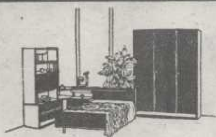
Dormitorio juvenil. Compuesto de armario ropero, cama cama, mesilla con galería de luz, rinconera, tocador, escritorio y librería.