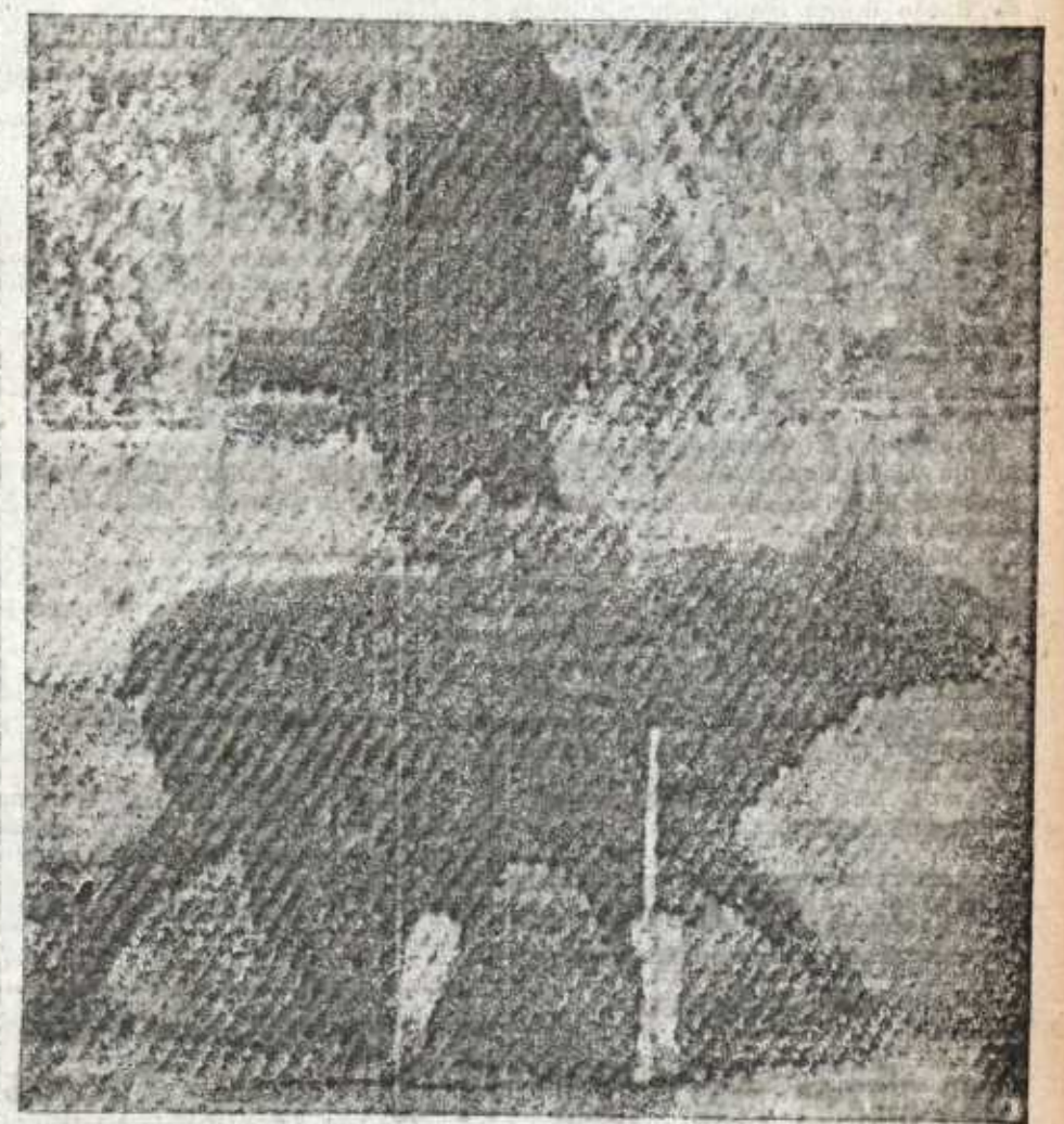
Larita pasando de muieta