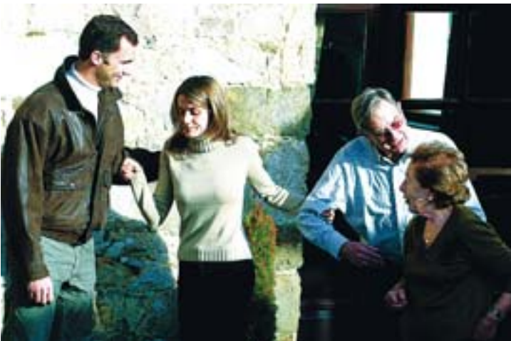
EN CASA. La pareja visitó a los abuelos paternos de la novia y paseó por los senderos al pie del Pagadín.