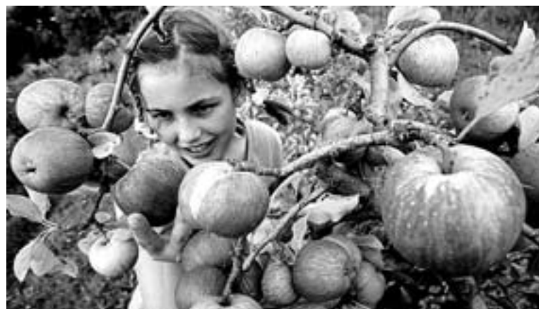
Una niña muestra manzanas de sidra de variedad autóctona.

Según Bionekazaritza la situación de las antiguas variedades de frutales es desastrosa. Han desapa-