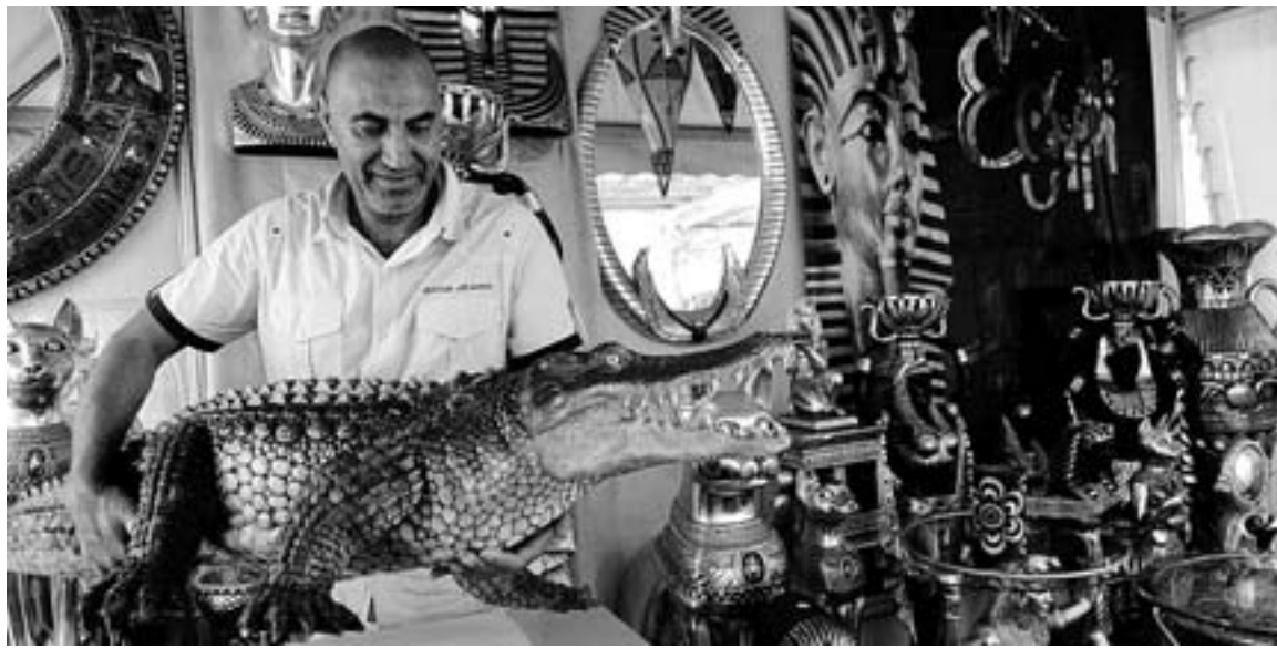
Los puestos de artesanía ofrecen los objetos más sorprendentes.

El horario del recinto es de lunes a jueves de 11.00 a 15.00 horas y de 17.00 a 23.00 horas. Viernes y sábados de 11.00 a 15.00 y de 17.00 a 24.00; y los domingos de 11.00 a 24.00 horas. Al entrar, la vista se pierde entre los stands de productos artesanales de más de 30 naciones y un poco más adelante, quien busque renovar la decoración del