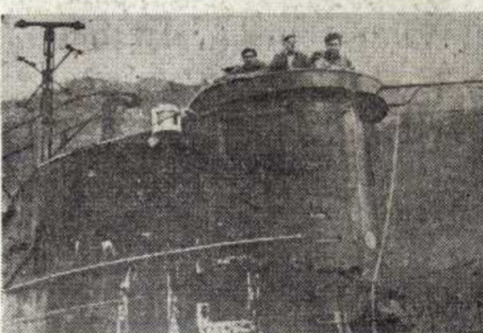
Los tres marineros que permanecieron en la torreta del submarino, desde su captura hasta llegar al puerto.

Marcarla la derrota del "María Jesús"; detrás, el submarino cogido por la proa por un calabrote de alambre. Detrás del sumergible, el otro pesquero descubridor, el "María del Coro", enganchando al submarino con otra cuerda o maleta. Cerrando la formación, el barco costero de la Escuadra "V-18" y el "Larra", que ane-