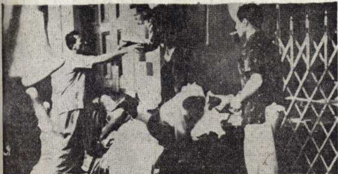
En la fotografía vemos el saqueo de una tienda en una calle de La Habana, durante el período que siguió a la marcha de Batista y antes de que nuevas autoridades responsables se hicieran cargo del orden público.

LA HABANA, 6.—Una muchedumbre ha tratado de penetrar en la Embajada británica, pero fue detenida por fuerzas de la milicia revolucionaria. La Embajada anunció, por otra parte, que ni súbditos ni propiedades inglesas han sufrido daños durante los últimos días de la revolución. (Efe.)