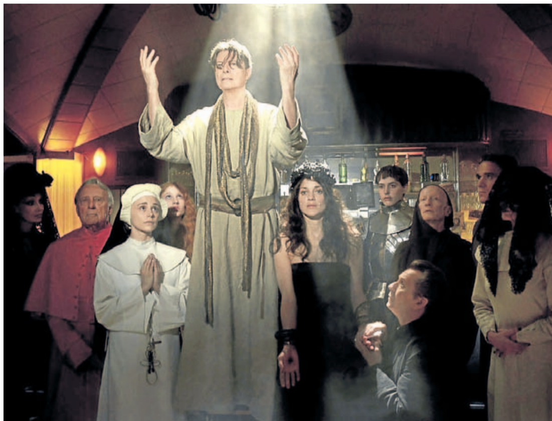
Los personajes de Oldman y Cotillard, entre otros, arropan a Bowie, caracterizado como profeta.

Bowie vuelve a reclutar a la veterana fotógrafa italo-canadiense Floria Sigismundi, que ya asumió la autoría de la pieza para el single