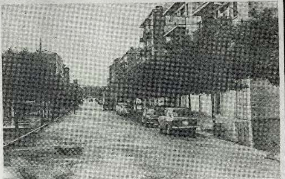
Una de las calles principales de Ariznavarra. Hacen falta más luz y más vigilancia.

—Como has podido ver hay trozos de acera sin asfaltar, las pequeñas zonas verdes que existen están tan poco cuidadas